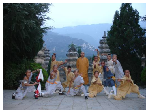
La Forêt des Pagodes

Renseignements : Coordinateurs nationaux M. TERCHAGUE A. ☎: 04.67.07.57.97 / 06.14.36.27.22 M. RAHIM M. ☎: 06.08.32.93.43 BP 85112 34073 Montpellier Cedex 3 ✉ KUNG FU DEVELOPPEMENT Sites Internet : www.kungfudeveloppement.com ou http://shaolinkungfu.free.fr E-mail : kungfudeveloppement@yahoo.fr