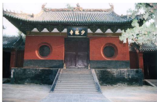
Le Temple de Shaolin