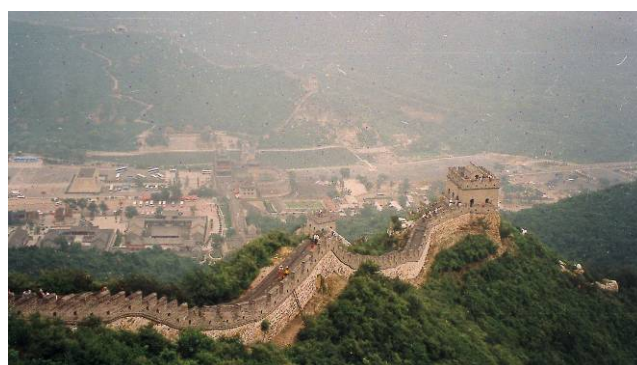
La Muraille de Chine